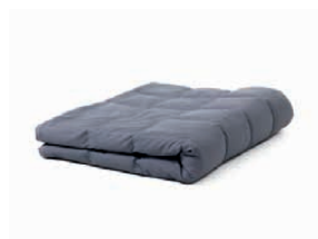
Verzwaringsdeken 70 x 120 cm