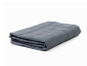
Verzwaringsdeken 140 x 200 cm