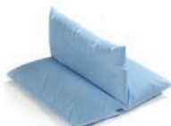
Abduction Art. 1549488