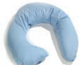
AVC Art. 1549490