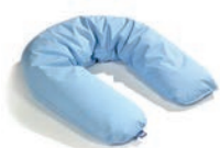
Standard Art. 1532842