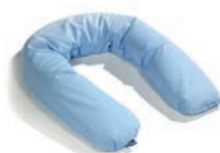
Standard XL Art. 1532844