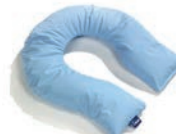
U-sit Art. 1549489