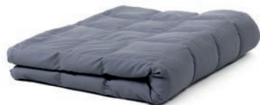
70 x 120 cm