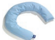
Baby XL Art. 1541222