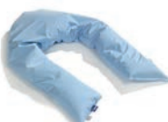
Chair Art. 1550466