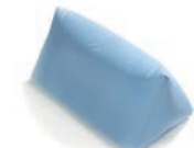
Genou Art. 1533148