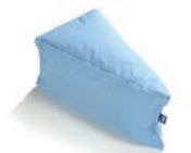
Abduction forme coin Art. 1540353