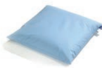
Pillow Art. 1540352