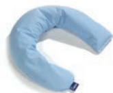
Baby Art. 1541015