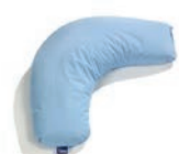
Compact Art. 1549970