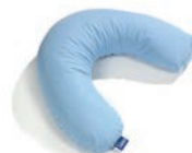
Oreiller cervicale Art. 1532847