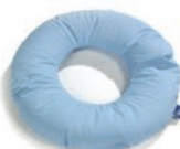
Donut Art. 1551148